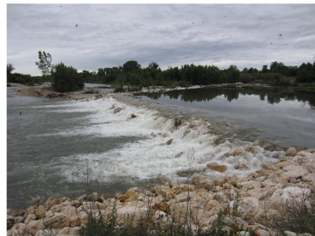
Seuil de Collias