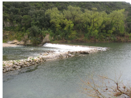
Seuil de la prise d'eau du canal de Beaucaire