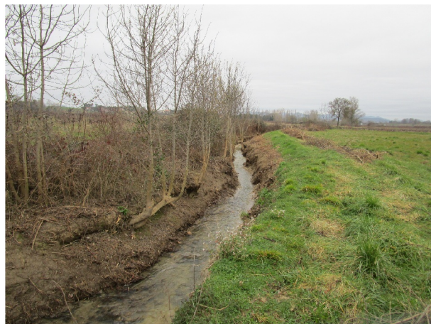
Exemple d'un cours d'eau en étude de restauration physique : l'Allarenque