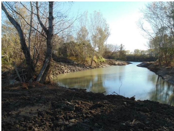
Réalisation d'une frayère à brochets à Comps par la Fédération de Pêche du Gard