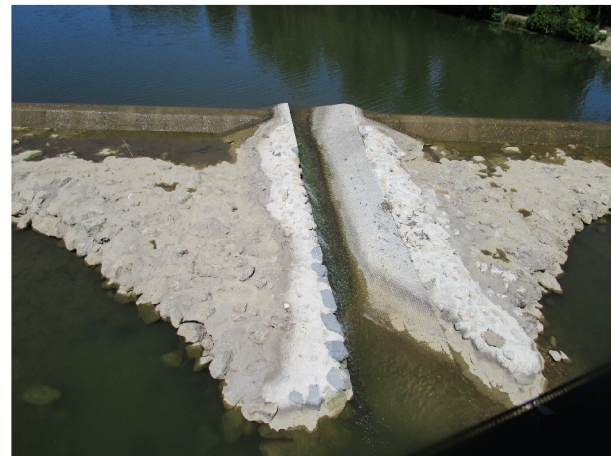
Réalisation d'une passe à anguilles sur le seuil de Moussac