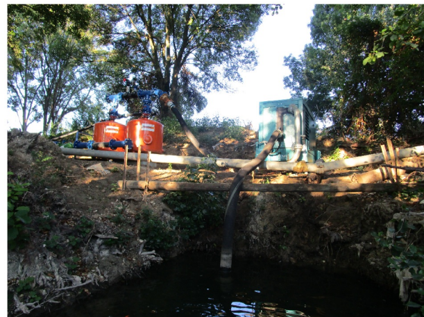
Captage direct en cours d'eau