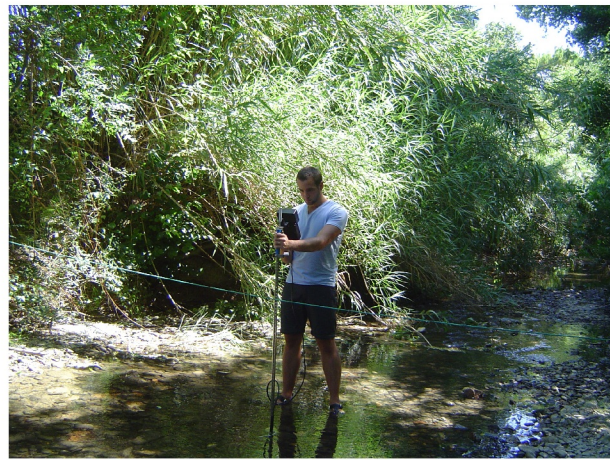
Opération de jaugeage